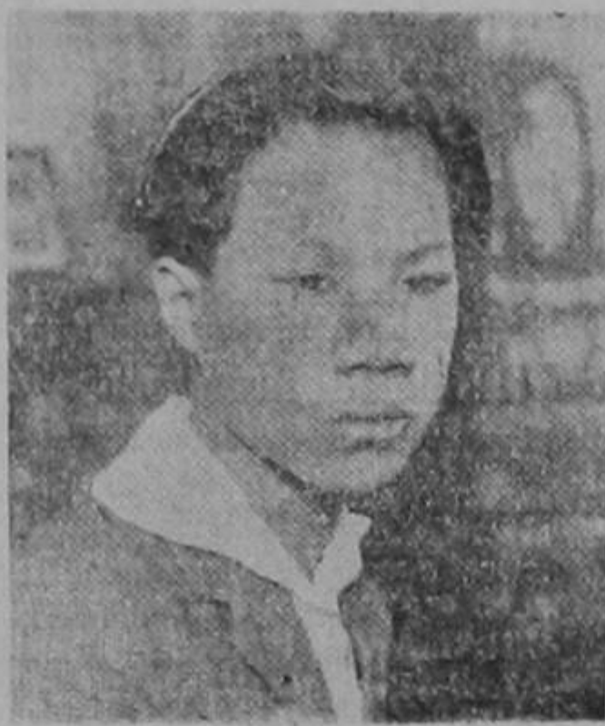
según reciente fotografía

bién como corresponsal especial del Chicago Daily News y otros periódicos americanos.